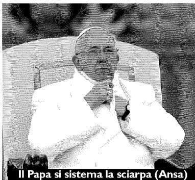
Il Papa si sistema la sciarpa (Ansa)

«Cristo è presente nei più deboli e bisognosi. La solidarietà nel compatire il dolore è condizione per ricevere in eredità quel Regno preparato per noi»