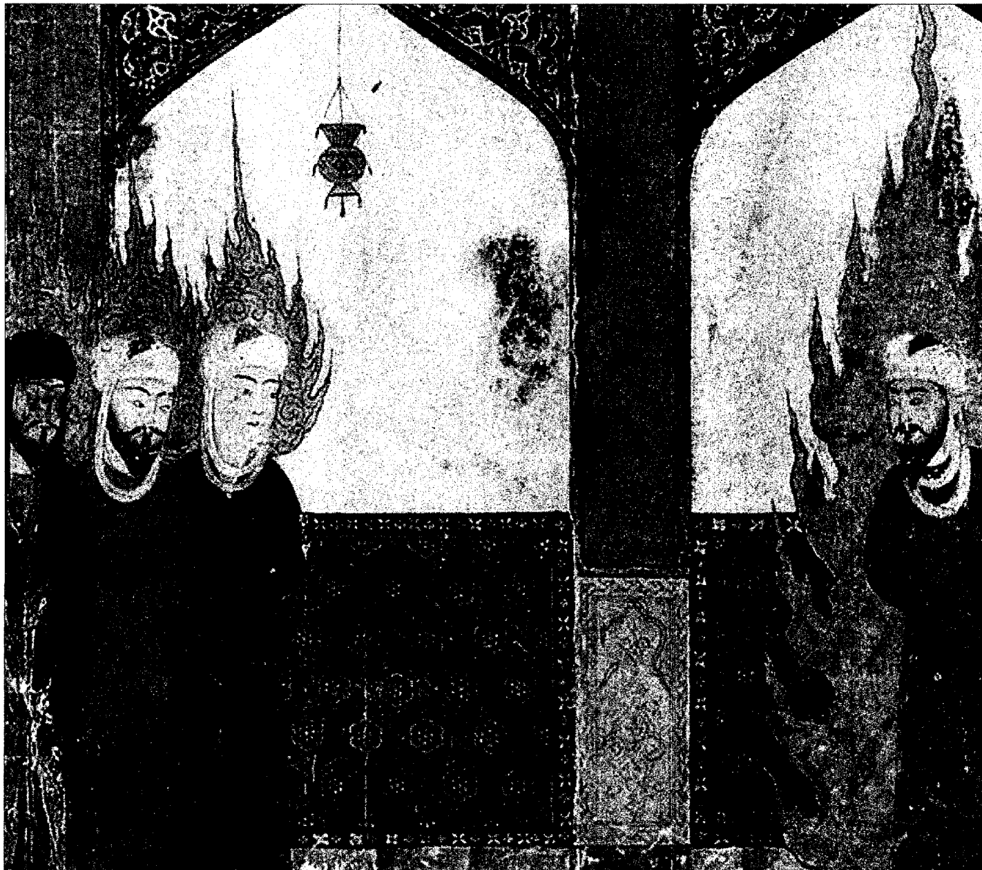
Maometto guida alla preghiera Abramo, Mosè e Gesù (da un manoscritto medievale persiano)