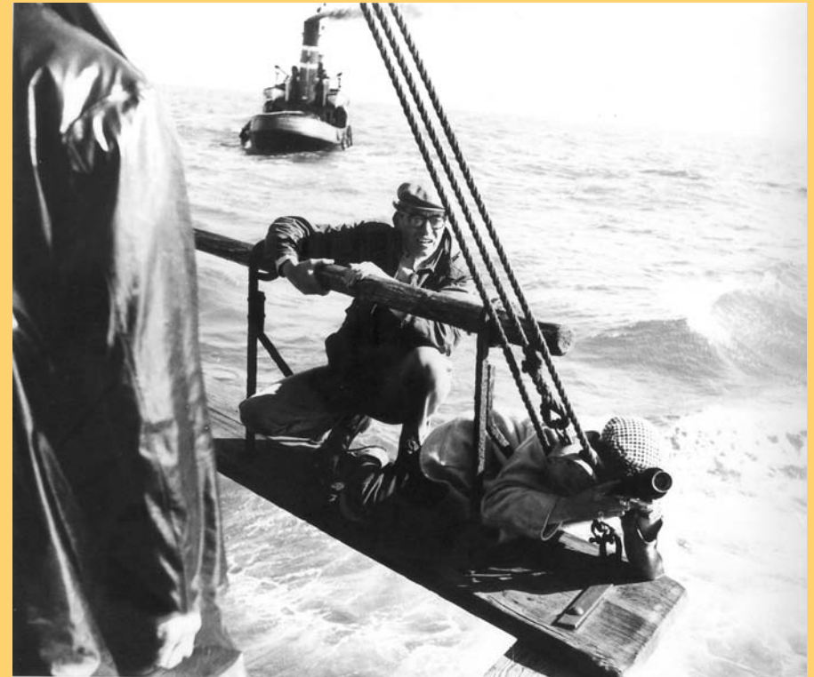
John Huston (a sinistra) al lavoro sul set di Moby Dick (1965)

Stampato nel mese di maggio 2007 © A cura di Centro Culturale di Milano e Sentieri del Cinema