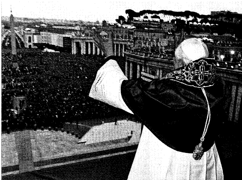
Il primo saluto di Papa Benedetto XVI dalla Loggia della benedizione (19 aprile 2005)