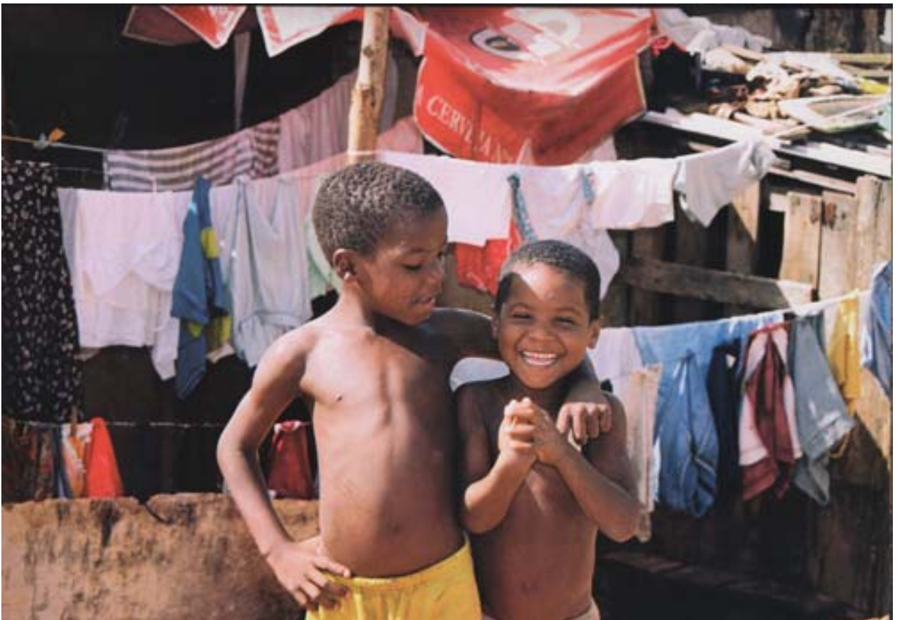
"La povertà come occasione" Balada de Caridade