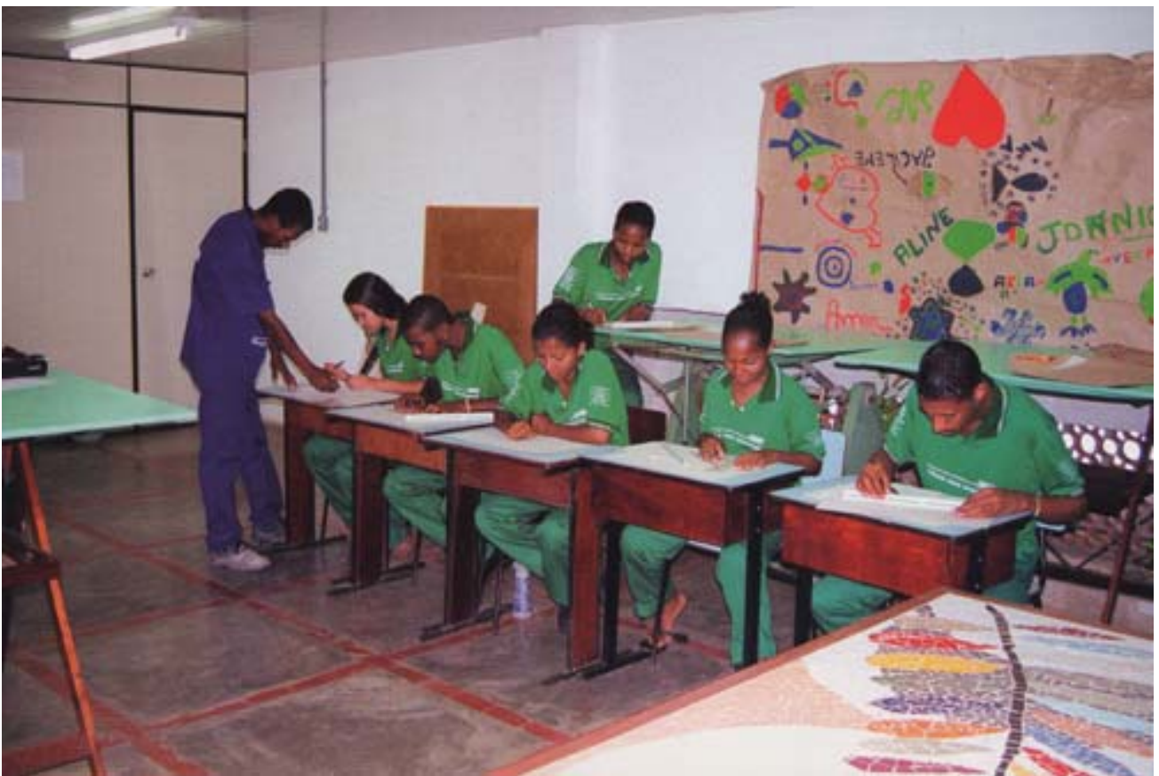
"La povertà come occasione" Balada de Caridade