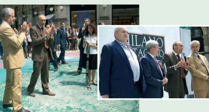
Nella foto la spettacolare inaugurazione di 'Milano-Ottagono' con Roberto Formigoni (Presidente Regione Lombardia), Piergianni Prosperini (Assessore Sport e Turismo), Davide Boni (Assessore Territorio) e Giorgio Cioni (Organizzatore di SA.SA. Eventi Speciali).

Laboratorio: Una carta per volare a cura della Cooperativa Sociale LaFucina