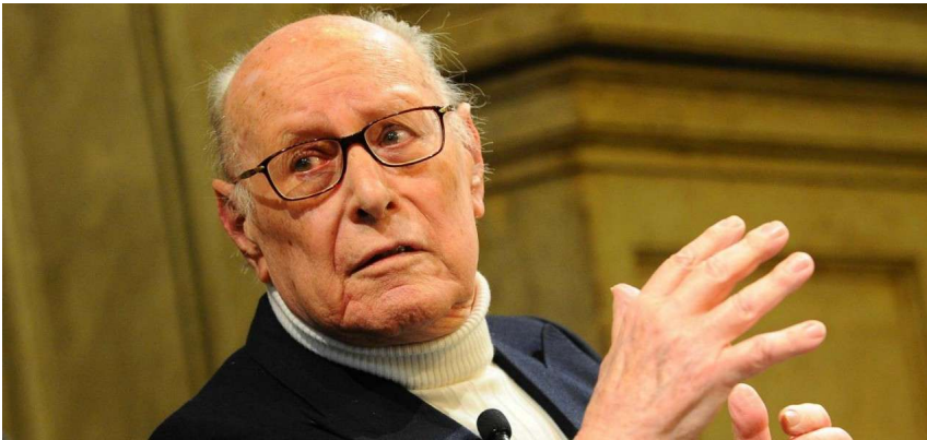
Emanuele Severino (1929-2020)

Il filosofo Emanuele Severino è scomparso all'età di 91 anni. L'autore, che lo ha conosciuto, spiega i capisaldi del suo pensiero, animato dal desiderio di un Destino perfetto