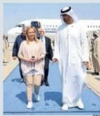
Giorgia Meloni ad Abu Dhabi

Il vertice della premier con lo sceicco Mohamed bin Zayed, presidente degli Emirati, servirà per cercare di portare avanti la riconciliazione con lo Stato del Golfo, dopo la clamorosa rottura diplomatica seguita alla decisione del