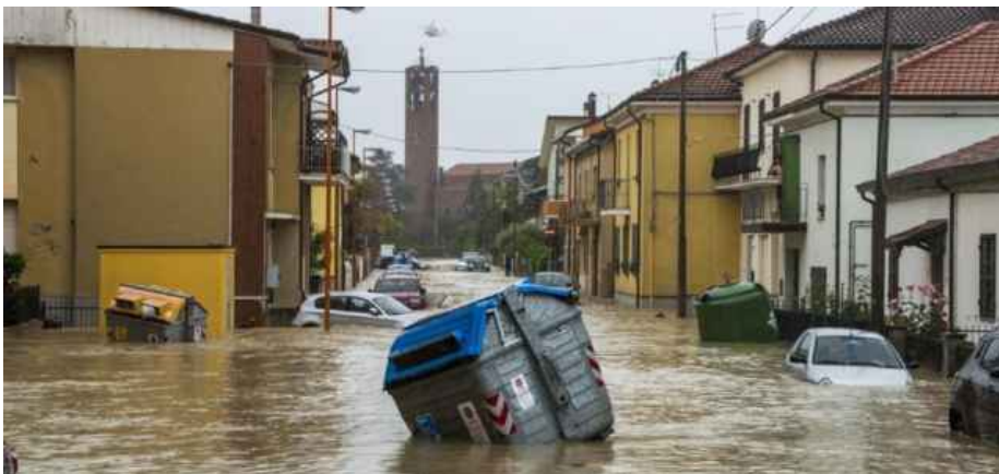
Ieri a Cesena

Precipitazioni di intensità sconosciuta e prevenzione mancante: queste le cause del disastro. Ora l'Emilia-Romagna dovrà ripartire. Come?